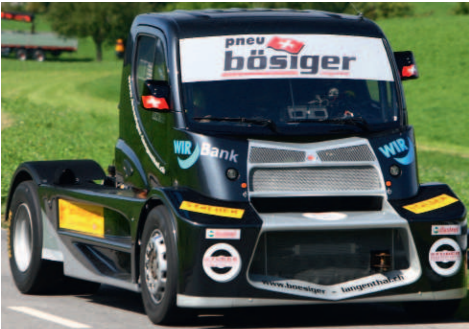
Der Buggyra Race Truck von Bösiger Langenthal fährt in diesem Jahr an Bergrennen mit – und steht am Stand der Trucker TIR in Interlaken.

Auch dieses Jahr wird die Herausgeberin der TIR transNews, die MotorMedia GmbH, vom 25.–27. Juni 2010 am 17. Internationalen Trucker und Country Festival Interlaken mit einem Stand vertreten sein, um ihre Produkte TIR transNews, BUS transNews, KMT kommunalTechnik, TruckerTIR und natürlich auch MotoSport Schweiz zu präsentieren.