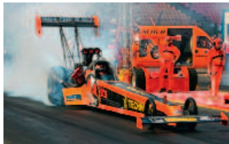
Der Top-Fuel-Dragster von Urs Erbacher in Aktion!

Zusammen mit dem Top-Fuel-Dragster wird am Stand von MotoSport Schweiz auch das Super-Twin-Bike zu sehen sein.